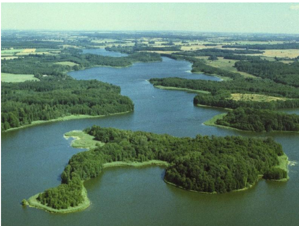
Die Schaalsee-Landschaft: ein Mosaik aus Wasser, Wald, Moor und Kulturlandschaft

Entlang der gemeinsamen Landesgrenze von Schleswig-Holstein und Mecklenburg-Vorpommern erstreckt sich ein glitzerndes Band kleiner und großer Seen. Diese Seenkette und das umgebende Hügelland verdanken ihren Ursprung der Weichselkaltzeit vor rund 20.000 Jahren. Gletscher, das von ihnen mitgeführte Material und das spätere Schmelzwasser haben diese Landschaft geformt. Heute wechseln sich tiefe Klarwasserseen mit dunklen Mooreseen und nährstoffreichen Flachseen ab, umgeben von breiten Reetgürteln und wasserreichen Bruchwäldern, Torfmooren und Feuchtwiesen. Hier leben Fischotter ( Lutra lutra ), und die große Rohrdommel ( Botaurus stellaris ), Kranich ( Grus grus ) und Eisvogel ( Alcedo atthis ). Hügelige Buchenwälder mit ungenutzten Altbaumbeständen ergänzen den Strukturreichtum. Sie bieten Greifvögeln und Höhlenbewohnern wie Spechten und Fledermäusen versteckte Nistmöglichkeiten. Die umliegenden Reste alter Kulturlandschaft prägt ein Netz aus Knicks, Hecken und Alleen. Die Vielfalt und enge Verzahnung der Lebensräume erklären das Vorkommen zahlreicher geschützter Pflanzen- und Tierarten und damit auch den großen Erlebniswert für die naturinteressierte Bevölkerung. Dies zu bewahren ist unser Ziel!