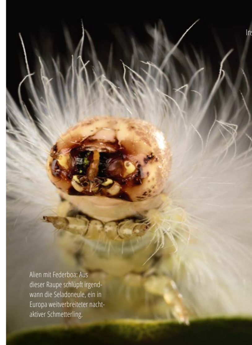
Alien mit Federboa: Aus dieser Raupe schlüpft irgendwann die Seladoneule, ein in Europa weitverbreiteter nachtaktiver Schmetterling.

Dass Insekten auf dem Rückzug sind, weiß die Fachwelt schon seit Jahrzehnten. Erst die 2017 veröffentlichte Studie des Entomologischen Vereins Krefeld brachte dem drastischen Insektensterben die notwendige Aufmerksamkeit der Gesellschaft. Ihr Fazit: Von der gesamten Biomasse der Insekten haben wir seit 1989 in Deutschland bereits drei Viertel verloren. Der dramatische Rückgang hat viele Gründe. Einer der Haupttreiber ist der Verlust der strukturellen Vielfalt auf großer Fläche. Unsere Landschaft wird eintöniger, weil die Landwirtschaft immer intensiver wird. Außerdem werden stetig weitere Böden durch Siedlungen und Straßen mit Asphalt und Beton versiegelt – laut Umweltbundesamt in Deutschland jeden Tag rund 55 Hektar. Auf diese Weise verschwinden zunehmend Insektenlebensräume – neben den natürlichen Habitaten auch Kultur-