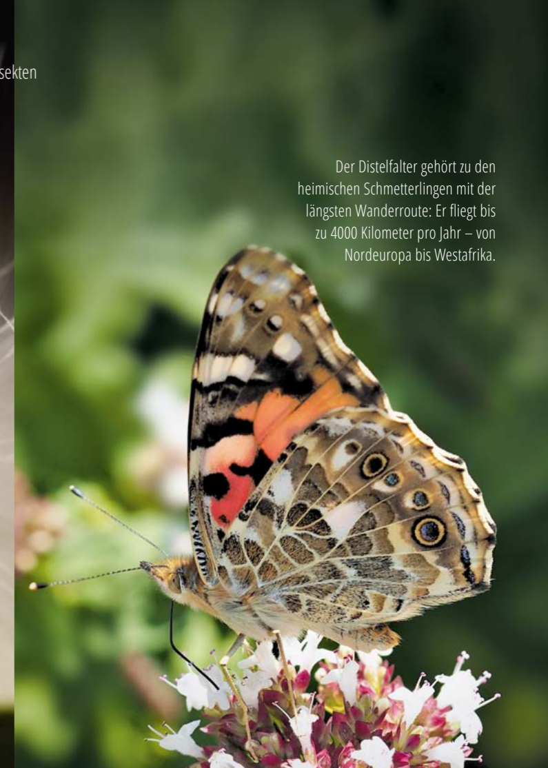
Der Distelfalter gehört zu den heimischen Schmetterlingen mit der längsten Wanderroute: Er fliegt bis zu 4000 Kilometer pro Jahr – von Nordeuropa bis Westafrika.