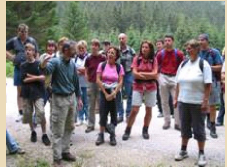
Bärenanwälte als Vermittler zwischen Tier und Mensch