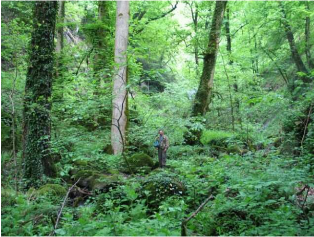
Im Leopardenurwald des neuen Gircan Nationalparks, Aserbaidschan.

den zuständigen Stellen, die bereits bestehenden Schutzgebiete effektiv zu schützen. Gleichzeitig setzt er sich