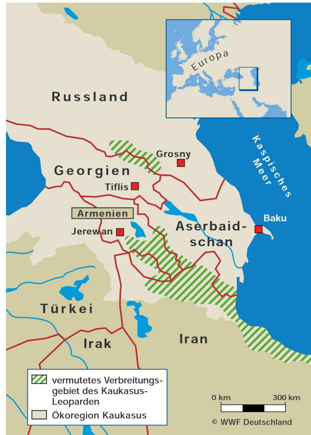
Die aktuell vermuteten Verbreitungsgebiete des Kaukasus-Leoparden.

weitere Tiere im Gebiet überlebt haben bzw. wieder eingewandert sind. Erschreckenderweise wurden mit derselben Kamera auch Wilderer photographiert. Es eilt, den Schutz der georgischen Leoparden sicherzustellen, bevor auch sie, wie der vermeintlich letzte Leopard in den 50er Jahren, Wilderern zum Opfer fallen, und damit die Art endgültig in Georgien ausgerottet ist.