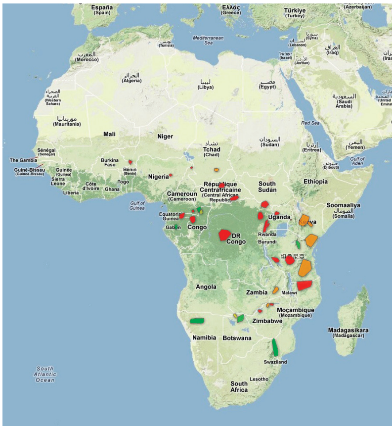
Karte mit Wilderei Schwerpunkten.

Die drei Vorfälle zeigen, dass sich der Charakter von Wilderei grundlegend verändert hat. Nach Schätzungen liegt der weltweite Umsatz des illegalen Handels mit Wildarten zwischen 7,8 bis 10 Milliarden US Dollar pro Jahr. Damit ist klar - das organisierte Verbrechen hat das Feld für sich entdeckt und wird häufig von Staatsbeamten und Militärangehörigen gedeckt. Damit ist der illegale Handel mit Wildtieren nicht nur ein Anliegen für Umweltschützer, sondern vielmehr eine Herausforderung, die die nationale Sicherheit der betroffenen Länder bedroht. Ganze Gesellschaften werden von innen destabilisiert, denn die Gewinne aus der Wilderei werden in manchen Regionen zum Beispiel in Zentralafrika zur Finanzierung regionaler Konflikte eingesetzt und führen nicht selten auch zu tödlichen Zusammenstößen.