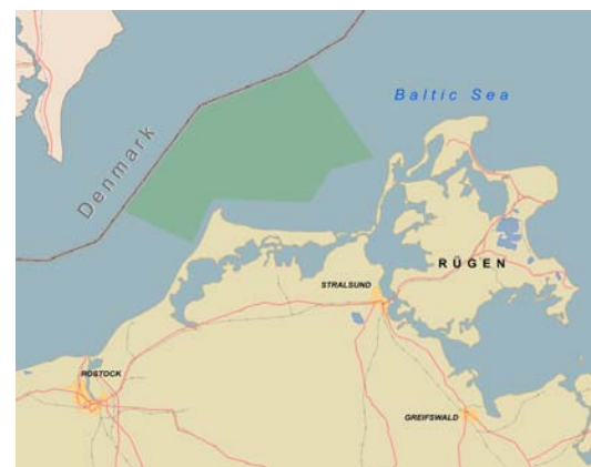
Abb. 4: Plantagenetgrund