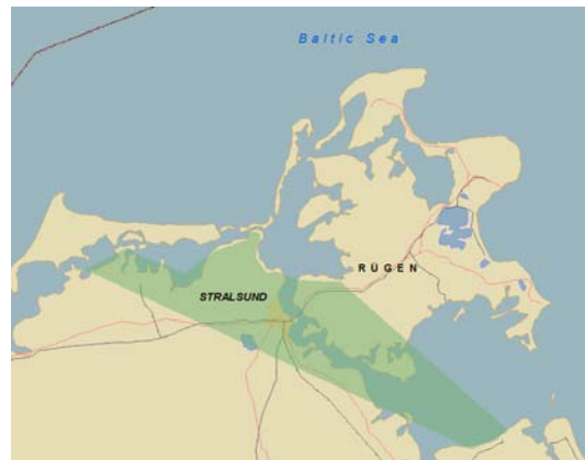
Abb. 2: Stralsund