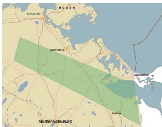
Abb. 3: Anklam