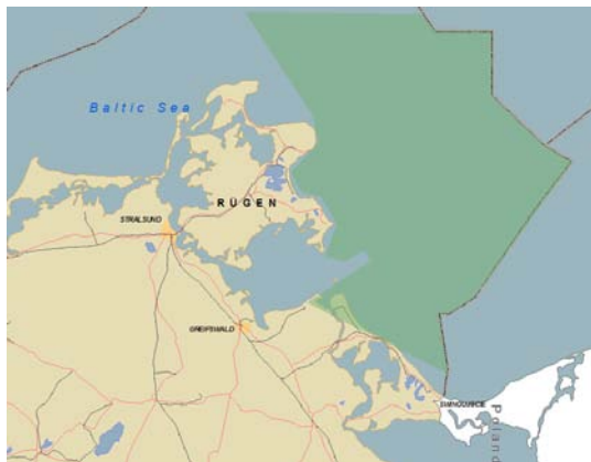
Abb. 1: Oderbank

CEP hält nach eigenen Angaben etwa 13.800 km 2 Erlaubnisfelder entlang vermuteter Erdöl- und Erdgasvorkommen in Mecklenburg-Vorpommern und Brandenburg. Die Abbildungen 1-4 zeigen einen Teil der geplanten Explorationsgebiete, die sich mit mindestens sechzehn Natura 2000-Gebieten in den Küstengewässern und der Ausschließlichen Wirtschaftszone (AWZ) überschneiden.