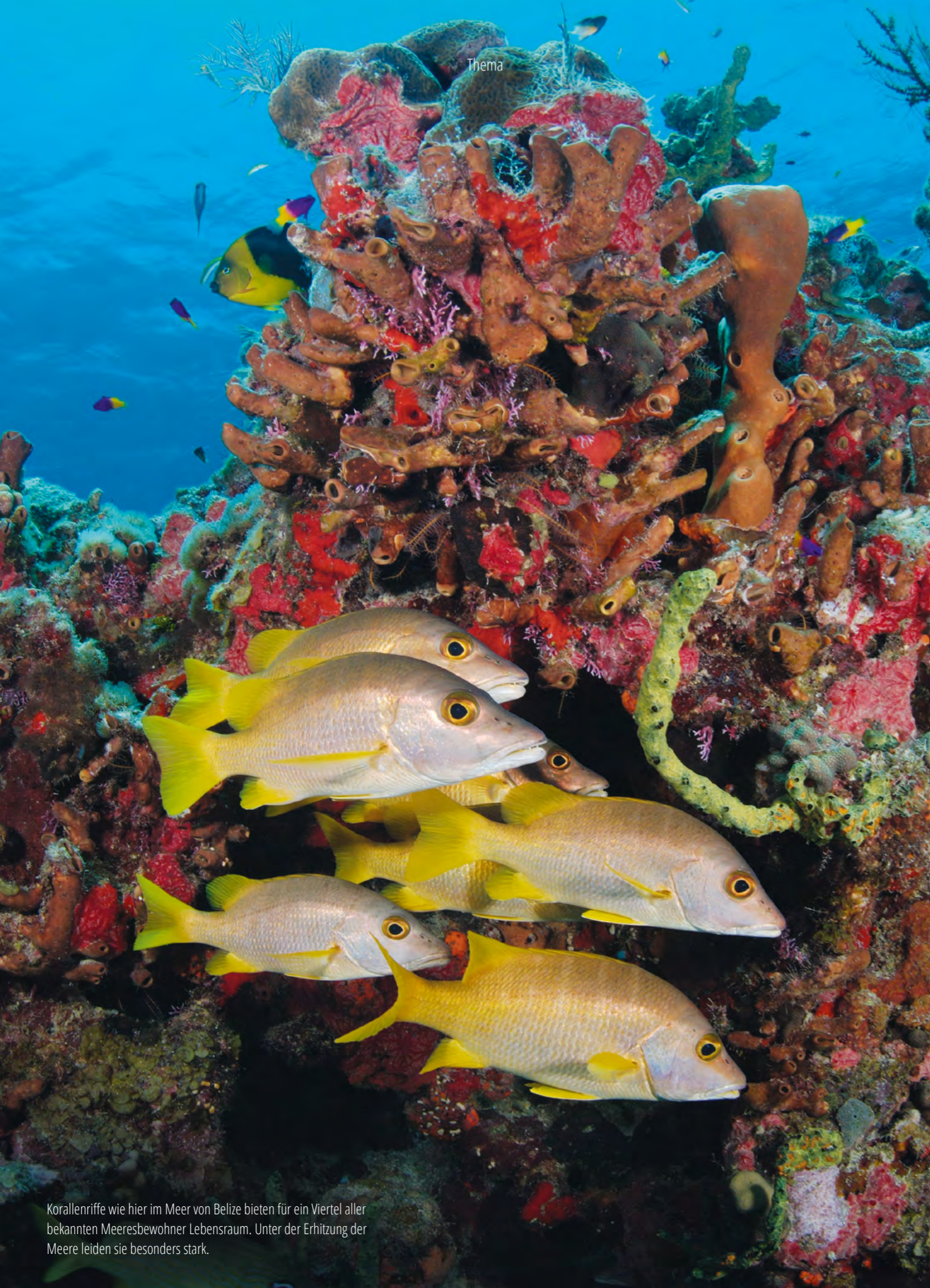
Korallenriffe wie hier im Meer von Belize bieten für ein Viertel aller bekannten Meeresbewohner Lebensraum. Unter der Erhitzung der Meere leiden sie besonders stark.