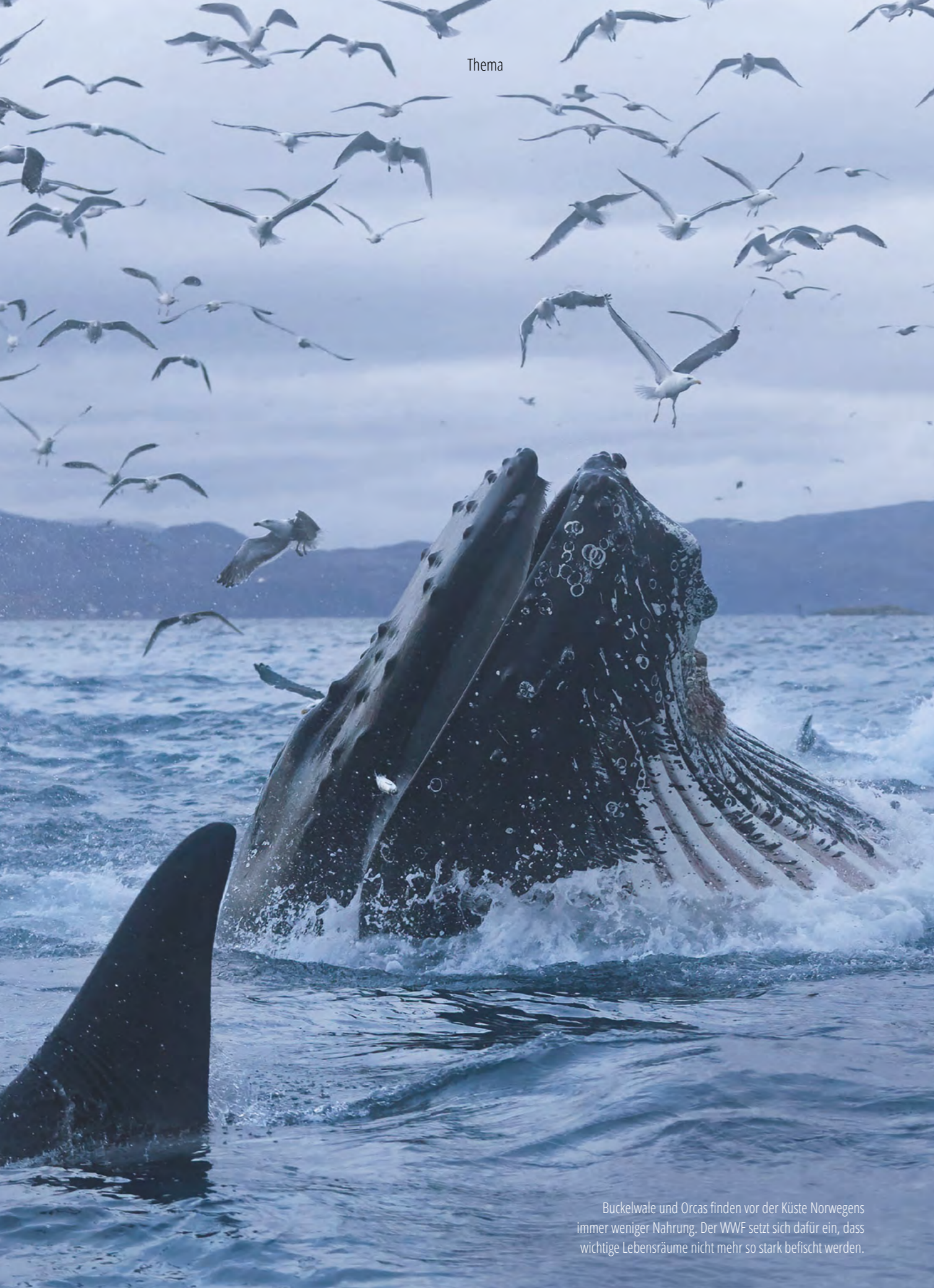
Buckelwale und Orcas finden vor der Küste Norwegens immer weniger Nahrung. Der WWF setzt sich dafür ein, dass wichtige Lebensräume nicht mehr so stark befishet werden.