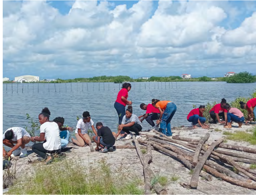
Der WWF forstet in verschiedenen Projekten zusammen mit der lokalen Bevölkerung geschädigte Mangrovenwälder wieder auf, wie hier in der Region des Mesoamerikanischen Riffs.

Im Meer um Belize beobachten Wissenschaftler:innen die Entwicklungen der weltweit einzigartigen Korallenriffe.