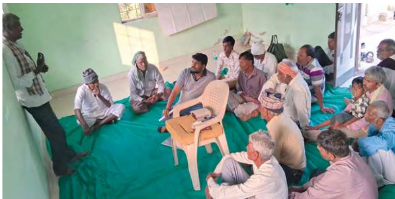
In Workshops erklären Farmer:innen, wie sie ihre Baumwollfelder effizienter bewässern und vor Schädlingen schützen können.

Mit smarten Insektenfallen haben WWF und CFT den Einsatz chemischer Pestizide in einer ersten Pilotphase um circa 40 Prozent gesenkt: Eine Infrarotlampe lockt auf dem Feld nacht-aktive Insekten an, die von einer Kamera fotografiert werden. Eine KI analysiert die Bilder und identifiziert Baumwollschädlinge. Die Befunde gehen per App an die 200 am Pilotprojekt teilnehmenden Farmer:innen. Diese wissen so frühzeitig, welche Schädlinge ihre Ernte bedrohen, und können gezielt dagegen vorgehen. Außerdem ist eine Wettervorhersage in die App integriert, die dabei hilft, die Bewässerung der Felder zu planen.