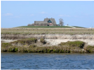
Priel-Kante auf Hallig Hooge: die Schichtung verdeutlicht, wie die Hallig seit Jahrhunderten mit dem Meeresspiegel mit wächst. Wächst die Hallig auch in Zukunft noch ausreichend in die Höhe?

Mit höheren Deichen allein sind diese Ziele nicht zu erreichen. Maßstab für Maßnahmen des Küstenschutzes sollte sein, dass sie möglichst immer beiden Zielen dienen. Sie sollten dem Wattenmeer dabei helfen, mit dem Meeresspiegelanstieg mitzuwachsen und zugleich die Natur möglichst wenig beeinträchtigen.