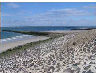
Mit teils massiven Befestigungen schränkt der Küstenschutz die natürliche Dynamik des Wattenmeeres ein. Mitunter mag dies notwendig sein. Zukünftig müssen wir gemeinsame Wege finden, solche Verbauungen stärker zu vermeiden

Die Vorphase der WWF-Projekte zum „Wachsen mit dem Meer“ wurde 2013 von der Umweltlotterie BINGO! Schleswig-Holstein unterstützt. In Kooperation mit dem schleswig-holsteinischen Umweltministerium erarbeitet der WWF derzeit eine internationale Übersicht über Optionen einer naturverträglichen Anpassung für das Wattenmeer. Seit 2015 entwickelt der WWF gemeinsam mit Partnern erste Pilotmaßnahmen in der Wattenmeer-Region und wird dabei durch das Bundesumweltministerium gefördert. Der WWF bedankt sich herzlich für die Unterstützung und Kooperation!