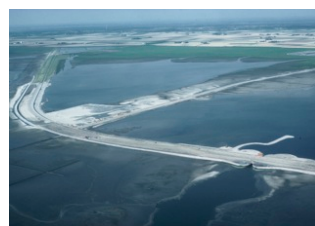
Als der WWF 1977 mit seiner Arbeit im Wattenmeer begann, wurden noch riesige Wattgebiete eingedeicht. Hier die Eindeichung der ehemaligen Nordstrander Bucht in den 80er- Jahren