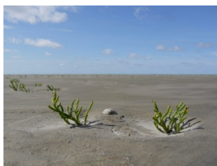
Nationalpark und Weltnaturerbe Wattenmeer: „Natur Natur sein lassen“ ist das Ziel für diese einma- lige Naturlandschaft